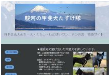
2018年 甲斐犬・特設サイト

多頭飼育崩壊・ブリーダー崩壊などに直面した場合は、多額の治療費が発生するため、マスコミに報道してもらったり、特設サイトを作って拡散するなどして、緊急的に寄付を呼びかけている。サイトでは動物たちの様子や、経費の報告などを細かく行い、多くの人が支援してくれるよう考慮している。