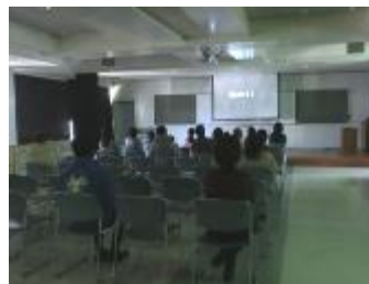
映画会（東日本震災関連）