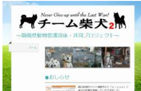
2017年 柴犬・特設サイト